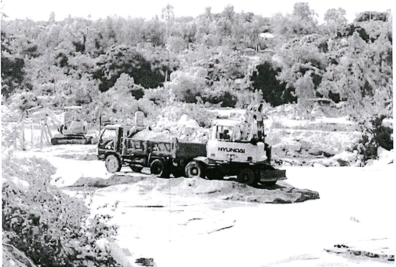
Xã Cam Phước Đông: Để xảy ra khai thác khoáng sản trái phép

Các tiểu cảnh ở 2 đầu đường Võ Nguyên Giáp: Cần nhìn nhận tổng thể