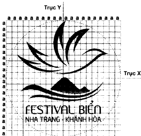
Logo trên lưới tỷ lệ và các trục cơ bản