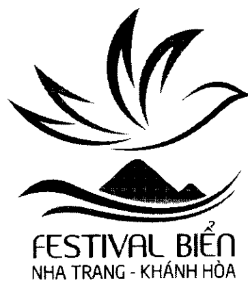
Hình 4. Mẫu đen trắng Biểu trưng Festival Biển Nha Trang – Khánh Hòa