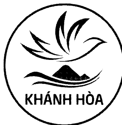
Hình 2. Mẫu đen trắng Biểu trưng tỉnh Khánh Hòa