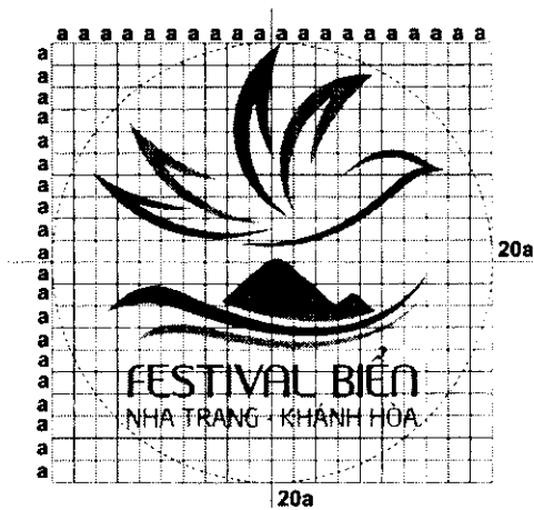
Logo trên lưới tỷ lệ