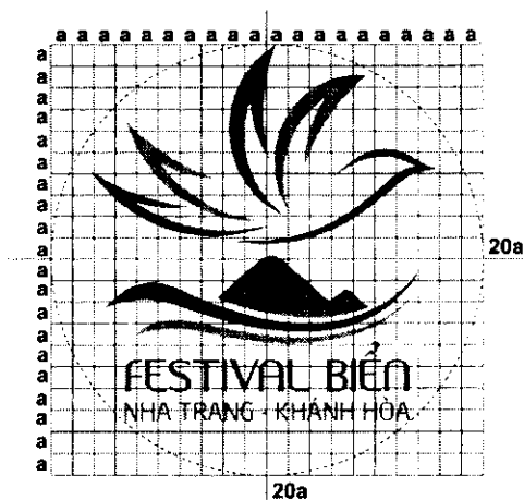
Logo trên lưới tỷ lệ