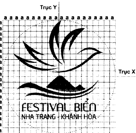
Logo trên lưới tỷ lệ và các trục cơ bản